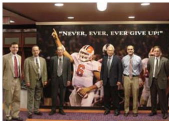
合作项目的推进成员