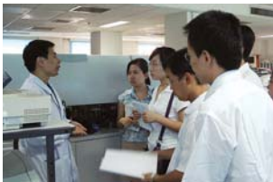
正在听取最尖端技术 讲解的实习生