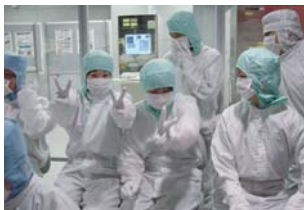
进入无菌室亲身体验