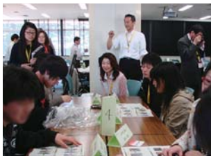
观察手机的半导体

当天有36名学生参加了活动。我们从微观的角度介绍了纳米高科技技术制造半导体的基本原理，除讲课外，还拆开手机取下了内部的半导体，通过用日立的电子显微镜进行观察，让学生们有一个真实的感受。另外，还通过参观无菌室和工厂，让学生们接触了半导体生产的部分工序。