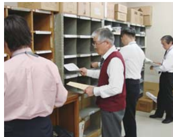
积极从事邮件的归类、收发等工作

*2：根据集团适用批准，母公司可以在包括其它相关子公司在内的企业集团中合计雇用率。