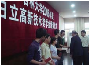
奖学金捐赠颁奖仪式