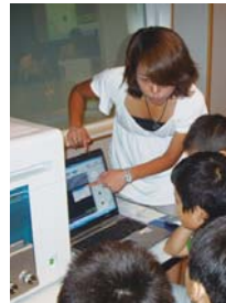
使用台式电子显微镜 进行近距离观察