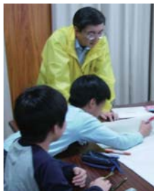
担任讲师的本公司员工

中部分公司派出员工作为志愿者为日立集团面向小学生举办的“共用性设计”课提供了协助。本教育援助项目是希望将日立集团拥有的知识和技术回馈社会的活动。在课堂上，我们从“产品制造”的角度向孩子们说明了要想建造所有人都能够便捷生活的社会，就必须具备“共用性设计”的理念。另外，我们还进行了盲人的模拟体验和“让所有人都能方便使用的电视遥控器”的设计。