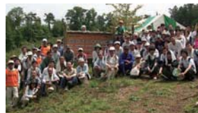
植树造林活动(关东地区业务网点)

我们集团开展了各种有利于环境保护的环保活动。2008年,来自日本东部各办公室的自愿者们参加了日立高新技术 Yasato 森林植树活动和在东京湾举行的城南岛海滩清洁活动。在日立高新技术维护公司,来自东部、中部和西部各办公室的自愿者们参加了HISCO森林植树活动。Kasado分部不仅参加了Hanaguri白滨海水浴场美化活动,还清洁了本地区域。