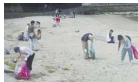
海滨清洁活动(笠户事业所)